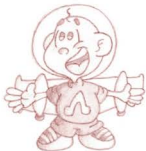
El Dragón Púrpura

No hay nada más puro, oh alegre flor, que lo que siento yo por vos, es amor, algunos lo confunden con tristeza o añoranza algo de razón tiene, pues lo refuerza la distancia. En este poema, le digo que la quiero, créame no miento, mis palabras no las lleva el viento, usted ha sido la musa de este chico, "a lossers", y poniendo fin a este verso, me despido con un beso.