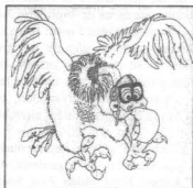
Nueva mascota de la revista

Aquellos que querais escribir , darnos ideas o publicar algún cómic en la revista, podéis hacerlo de cualquiera de estas tres maneras: